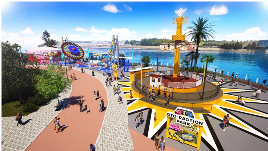
OTO-RACTION PARK (画像はイメージ)

八景島ならではの立地を活かし、海に隣接する回転、揺れ、高さをテーマにした個性豊かなアトラクションとともに、AIが創り出す音楽空間で新感覚なエンターテインメントをご堪能ください。