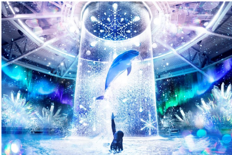
「CRYSTAL SNOW DOME」※イメージ