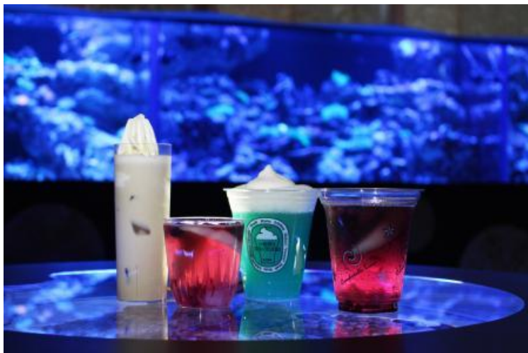
オリジナルドリンク4種 ※イメージ