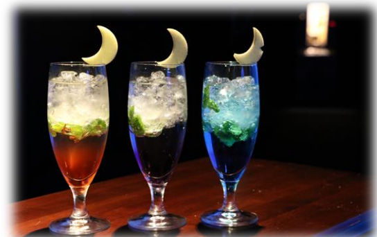
「ノクターナルモヒート」