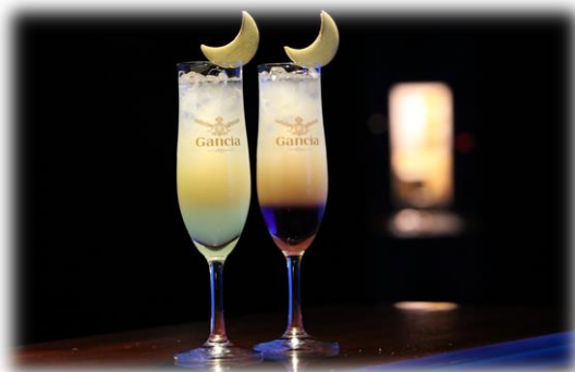
「ノクターナルカクテル」