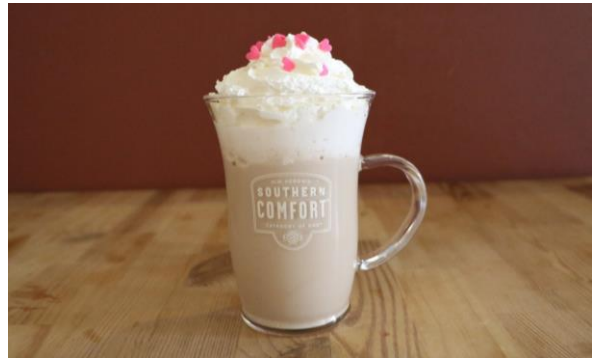
ホットゴディバミルクカクテル 700円

期 間 : 2月1日(木)~14日(水) 場 所 : 「CLASSIC」、「NOCTURNAL LOUNGE」、 ほかベイマーケット一部店舗