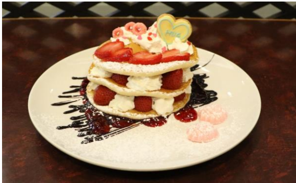
バレンタインパンケーキ 1,200円

イベント期間中、ベイマーケット一部の店舗では、バレンタインならではのオリジナルフードやドリンクを販売いたします。フードコート&カフェ「CLASSIC」では、イチゴをふんだんに使用したボリューム満点の「バレンタインパンケーキ」を、ナイトラウンジ「NOCTURNAL LOUNGE (ノクターナル ラウンジ)」では、寒い時期にも温まるカクテル「ホットゴディバミルクカクテル」を販売いたします。バレンタインオリジナルメニューで心も体も温まってみてはいかがでしょうか。