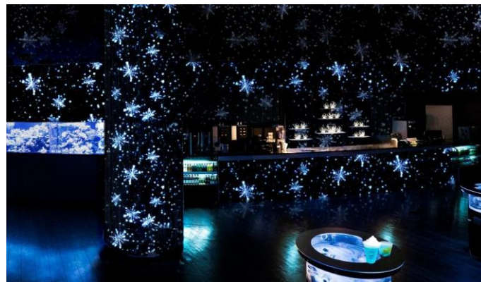
「CRYSTAL BAR」 ※イメージ 【左:通常演出/右:スノウタイム(雪が降る)演出】