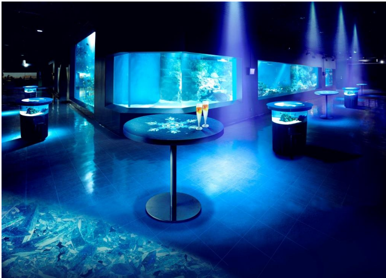
「NIGHT BLUE LOUNGE」※イメージ