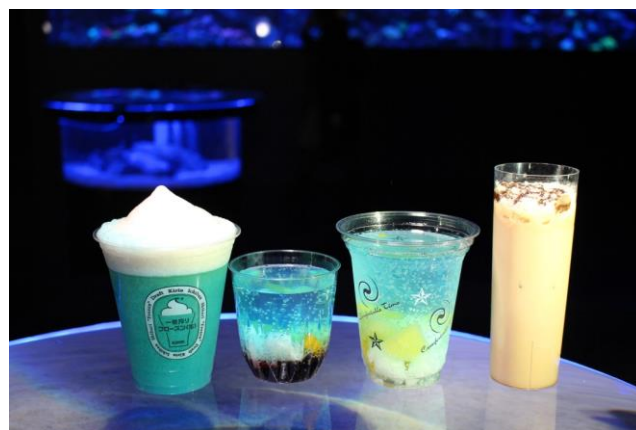
オリジナルドリンク4種 ※イメージ 【画像左より、①②③④】