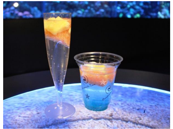
限定メニュー《オリジナルドリンク》※イメージ