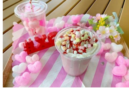
「春のいちごみるく」 料 金：500円 場 所：ブリーズ

イチゴミルクにホイップクリームやいちごソース、カラフルなミニマシュマロをトッピングした全体的に桜色で可愛いドリンク「春のいちごみるく」など、視覚だけでなく味覚でもお花見シーズンを盛りあげます。