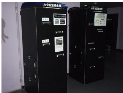
【画像：マリンピア松島水族館ホタル展示の様子（2013年）】

2015年5月に閉館した「マリンピア松島水族館」では、2012年から2014年まで毎年ホタル展示を実施していました。これは、当時の飼育スタッフが泉ヶ岳で見たホタルの風景に感動し、お客さまへ伝えたいという想いから始めたものでした。ホタル展示は、自然界から成虫を採集して展示するわけではなく、幼虫から飼育していく必要があるため、容易ではありません。2012年は採集個体を15日間展示することができましたが、繁殖個体を成虫に成長させることはできませんでした。