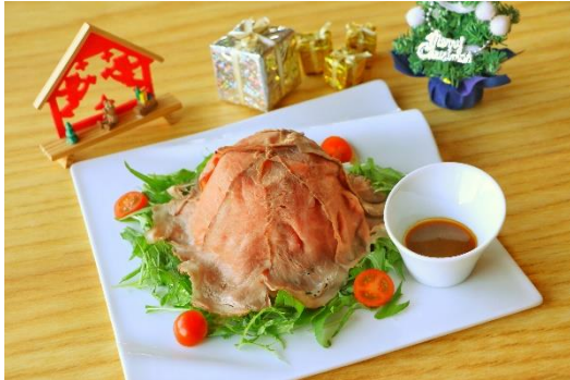
「ローストビーフライスボールプレート」 料金：1,700円 場所：哉介

島内のレストランや軽飲食店舗では、ローストビーフがメインのプレートや、体の芯から温まるホットドリンク、いちごがたっぷり入ったクレープやパンケーキなど、クリスマスにぴったりのオリジナルメニューが登場いたします。