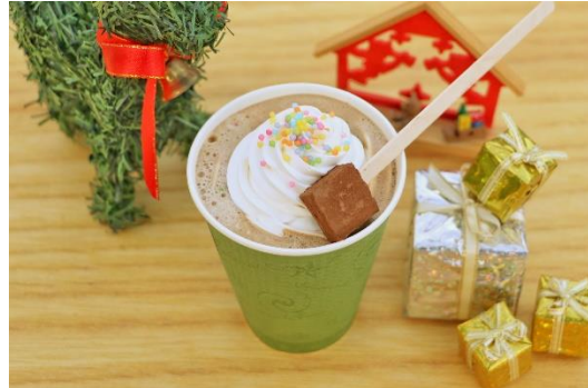
「クリスマスモカスペシャル」 料金：500円 場所：ケーブルカーコーヒー