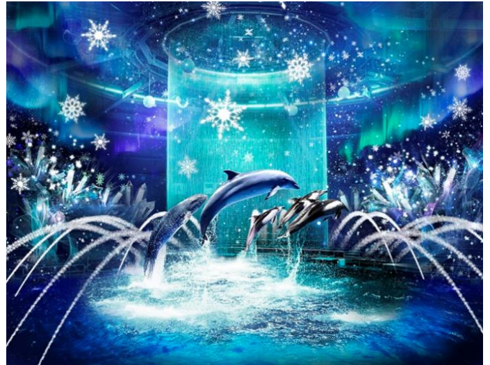
「BRIGHT CRYSTAL ※イメージ」

【水(噴水、ウォーターカーテン)】・【光(ムービングライト、水中照明)】・【映像(プロジェクションマッピング)】・【音(12.1chサラウンド)】などの最先端技術とイルカたちのダイナミックなパフォーマンスが織りなす、唯一無二のプログラムです。デジタルアートで描かれるクリスタルやオーロラ、雪の結晶が円形スタジアムの一面に広がり、そのきらめきに連動するようにイルカたちが華やかなジャンプを繰り返します。360度美しい冬の世界観につつまれる、“没入型ドルフィンパフォーマンス”がお楽しみいただけます。