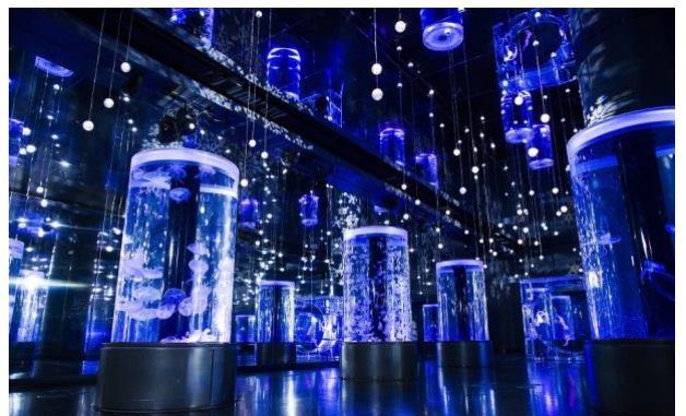
「ジェリーフィッシュランブル ※イメージ」

天井と両壁が鏡面になっている、幅約9m×奥行約35mの大空間。エリアには7つの円柱水槽と全面クリスタルのシンボリックな水槽が並び、ミズクラゲやインドネシアシーネットルなどが優雅に漂います。今回は、頭上から下がる98個のLEDライトと水槽照明をブルーやホワイトに変更し、さらに北欧調のメロディーを用いることで“冬の美しさ”を表現します。無限に広がる光とクラゲによる、まるで雪が舞い降りるかのような幻想空間がお楽しみいただけます。