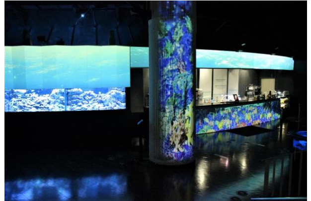
「コーラルカフェバー ※イメージ」

12月26日(土)～2021年2月28日(日)までの期間、冬の輝きや淡雪をイメージした季節限定メニューの他、昨年大好評いただいた当館オリジナルデザインのスーベニアボトル付きドリンクも販売いたします。