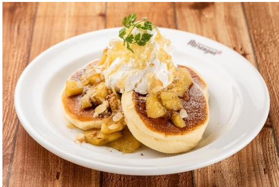
「ローステッドアップルパンケーキ」 料金：1,400円 場所：メレンゲ