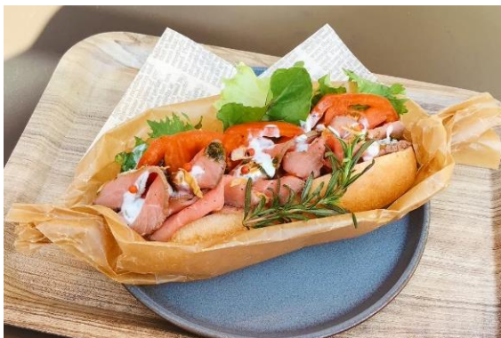
「ローストビーフのバケットサンド」 料金：880円 場所：コバラカフェ