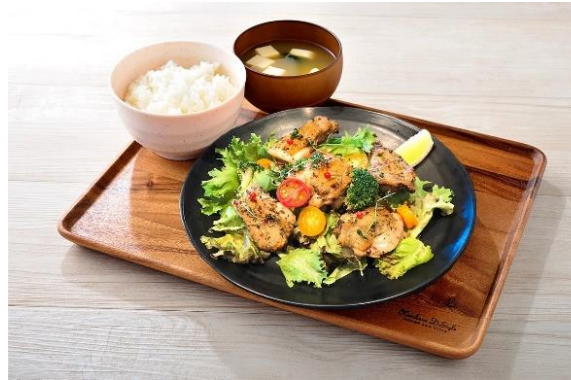
「ハーブチキン定食」 料金：1,280円 場所：ラ・タラフク