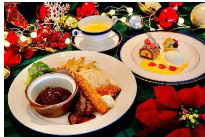
コースディナー(子ども)

※公式HP ( http://www.seaparadise.co.jp ) にて販売しております。