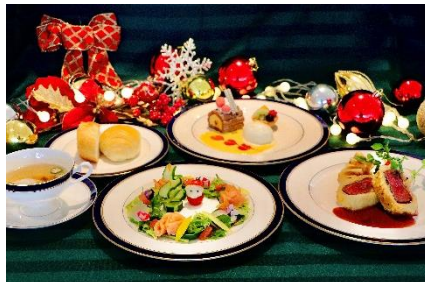
コースディナー(大人)