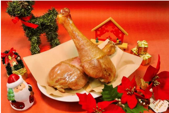
「スモークターキー」 料金：850円 場所：ドルフィン

島内のレストランや軽飲食店舗では、クリスマスにぴったりなスモークターキーレッグやローストビーフがたっぷり入ったサンドイッチ、チョコレート味のモンブランなど、クリスマスにぴったりのオリジナルメニューが登場いたします。心も体も温まるホットドリンクもご用意しておりますので、寒い冬も存分にシーパラをお楽しみください。