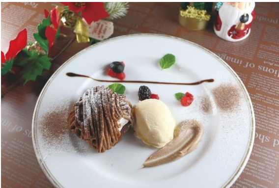
「チョコモンブラン」 料金：750円 場所：ブーズカフェ