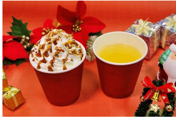
左「ヘーゼルナッツラテ」／右「ホットハニーレモネード」 料金：「ヘーゼルナッツラテ」 590円 「ホットハニーレモネード」 390円 場所：ドルフィン