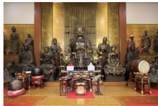
東京都指定有形文化財 本尊および五百羅漢像

終活フェア2026のお帰りの際に ゆっくりと「目黒のらかんさん」に お参りしてください。