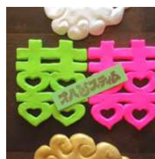
オハスティム：審査員特別賞