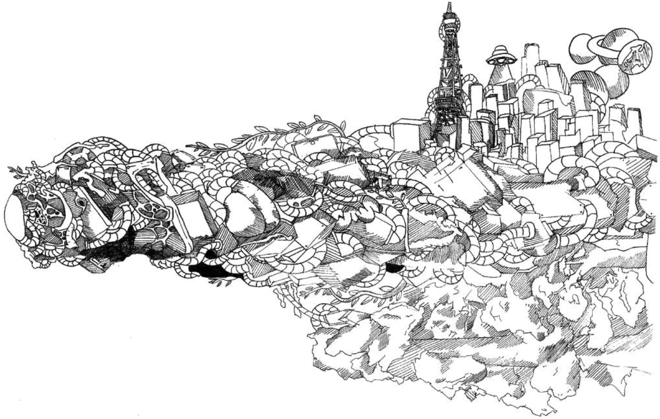
Illustration by IKKU