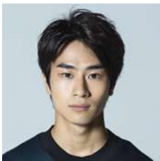
前田旺志郎 / 俳優

2000年生まれ、大阪府出身。子役としてデビュー後、2007年から兄・航基とお笑いコンビ「まえだまえだ」として活躍。現在は主に映画、ドラマ、舞台で活動し、2021年の朝ドラ『おちょやん』の松島寛治役で話題に。