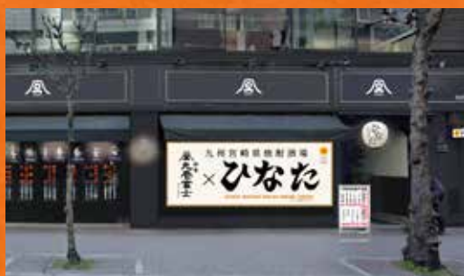
丸倉富士 銀座コリドー店が期間限定で「ひなた」になります ※「ひなた」は池尻大橋で期間限定で営業し、惜しまれつつも閉店した宮崎焼酎酒場です