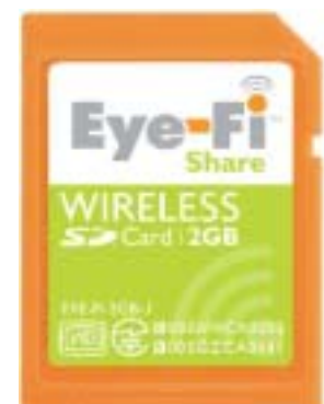
『Eye-Fi Share カード』 商品画像