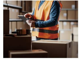
製造/物流 工程管理ラベル、現品票など