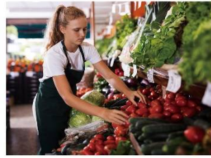
小売 マークダウンラベル、産直ラベルなど