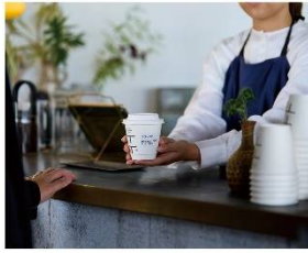
カフェ&レストラン 食材管理ラベル、食品表示ラベルなど