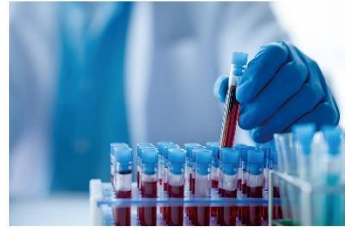
医療 検体ラベルなど