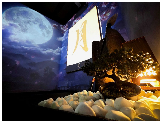
ROOMDIVE を活用したイマーシブ空間での「SHODO STAGE」