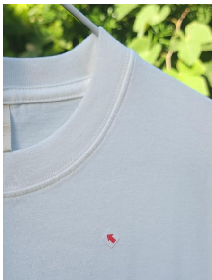
赤い矢印の先の“小さな暗い点”がコンタミ箇所（写真は無加工）

株式会社 OpenFactory が展開する、インターネットとデジタルプリントを使いユーザーと工場のビジネスをオンデマンドでつなぐサービス「Printio（プリンティオ）」による、余剰在庫や規格外資材など通常は廃棄される製品にプリントを施し市場への再流通を試みるプロジェクトです。