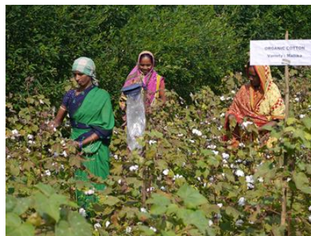
手摘みで行うゆえにコンタミが発生する綿花の栽培