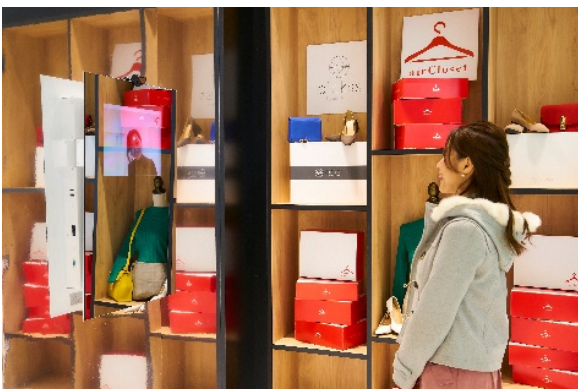
遠隔ファッション診断 体験イメージ

2019年3月9日(土)と3月10日(日)に長野駅で、3月18日(月)から3月21日(木・祝)まで品川駅で実施します。