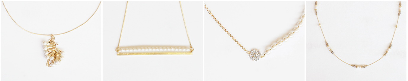
▲取扱アイテムの一例