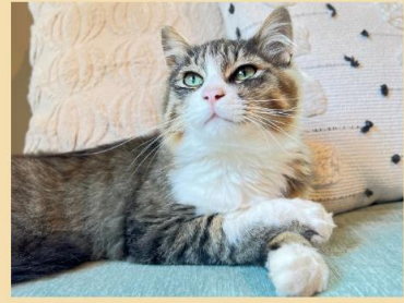
ドーナツ 男の子 2022年9月生まれ