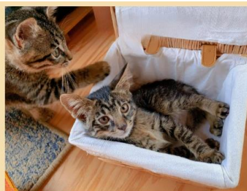
トム 男の子 2021年3月生まれ(推定)