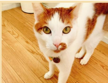
ドル 男の子 2016年12月生まれ(推定)