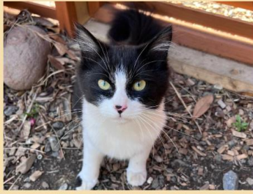
クルエラ 女の子 2022年9月生まれ