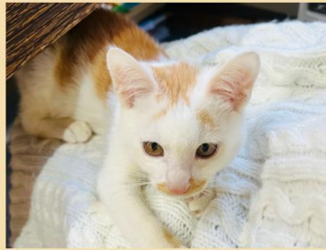
アンコ 男の子 2021年10月生まれ(推定)