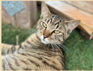
シャシャ 男の子 2022年9月生まれ