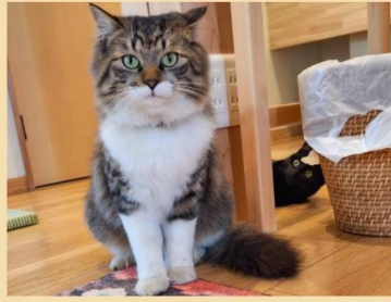
アリエル 女の子 2022年9月生まれ