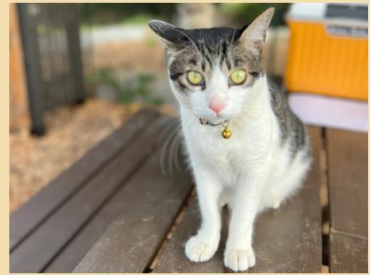
ゴールド 男の子 2019年6月生まれ(推定)