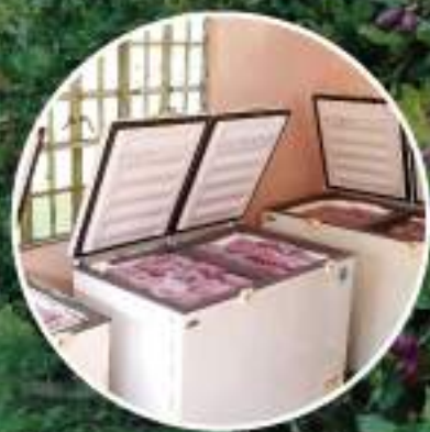
検品後の冷凍保管