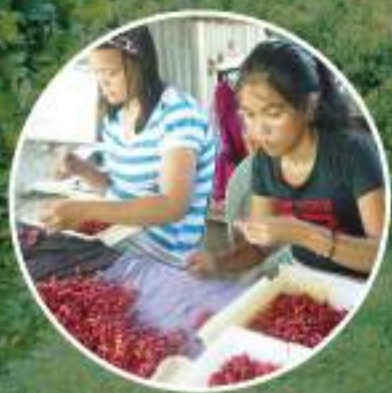
1粒1粒丁寧に検品及び加工