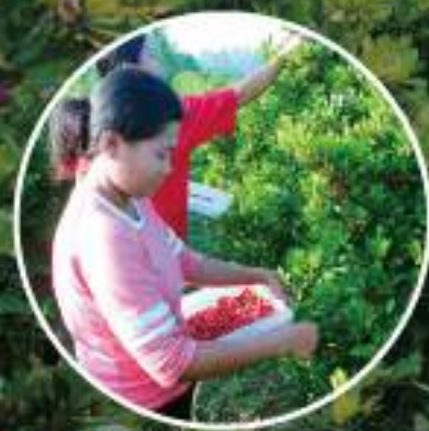
1粒1粒丁寧に手摘みによる収穫