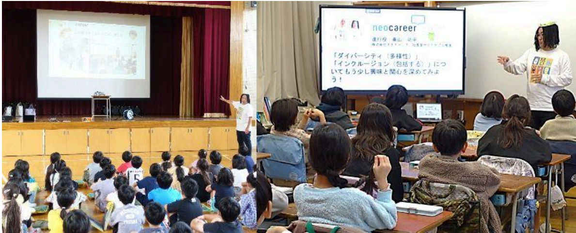
<左> 早稲田大学の環境サークルと協働で新宿区の小学校に環境教育出前授業を実施 <右> 多様な視点から2050年の新宿区を考える出前授業を実施