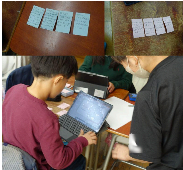
<上>4つの観点から自分の考えを付箋に書き出し整理していく <下>タブレットを使用しサステナブルアルバムを作成する児童たち

サステナブルアルバムは、児童たちが1年間に学んだことや感じたことを振り返るだけでなく、保護者にもその成果や想いを共有できる内容となりました。そして、学校・地域・大学・NPO法人・企業が連携して行われたこの取り組みは、サステナブルアルバムの作成を通して児童たちの学びや想いが形として残り、次世代にサステナブル教育のバトンが繋がれていく取り組みとなりました。