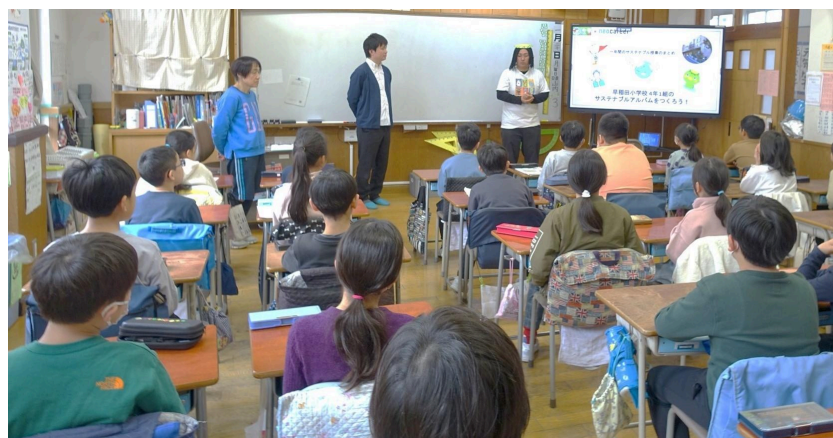
サステナブルアルバム作成の授業風景

公開授業は保護者の方々が見守る中で行われ、児童たちはこれまでの学びを振り返ることからスタートしました。児童たちはこれまでの学びを踏まえ、「この1年で学んだこと」「私が考える未来の地球や社会」「こんなサステナブルな大人になるぞ！」などの観点で意見を出し合い、タブレットを活用してスライドを作成。保護者の方々に見守られながら、これまでの学びや未来への意思が共有されました。