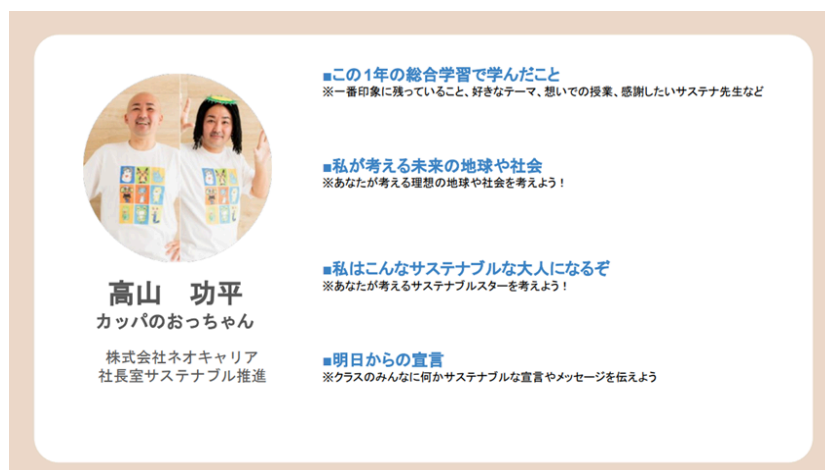
タブレット端末を使用して作成するサステナブルアルバム