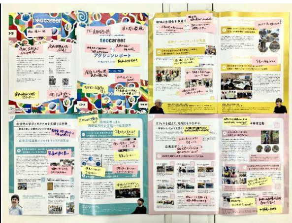
＜左＞レポートにコメントを記載する参加者 ＜右＞参加者の皆さまからいただいたフィードバック(一部抜粋)