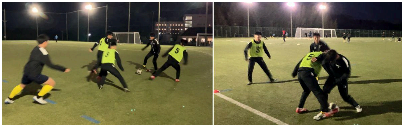
部活動に取り組む昌平高校サッカー部の皆さま

生徒たちには、スポーツに本気で取り組み、思い切り挑戦してほしいと考えています。今回の取り組みを通じて、自分たちの活動が、応援してくれる大人や地域の支えによって成り立っていることを知ることは、非常に有意義な経験であり、今後の人間形成の上でも大きな意味を持つものだと思います。また、生徒たちが将来のキャリアについて考えるきっかけになることを期待しています。