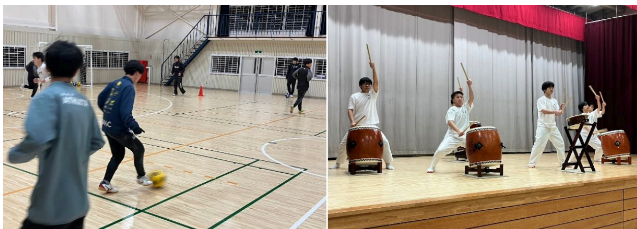
向陵高校サッカー部（左）太鼓部（右）の活動の様子

地域企業からのご支援を賜り、大変光栄に存じますとともに、それに恥じぬ活動と成果を目指してまいります。今後も祭りや地域を盛り上げる活動に積極的に取り組み、自分たちにできることを改めて考えながら活動していきたいと考えております。また、就職を希望する生徒も多いため、本スポンサー活動を通じて、生徒一人ひとりが将来の目標を見つけられるようにつなげていきたいと考えております。