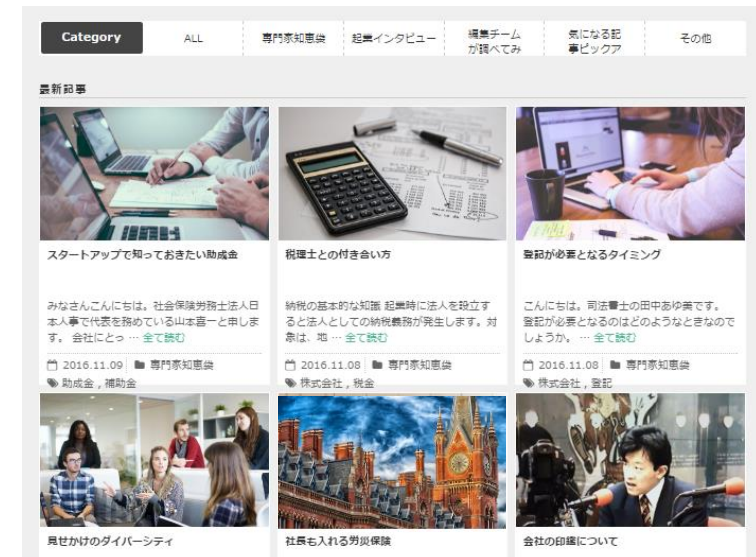
《コンテンツ イメージ》