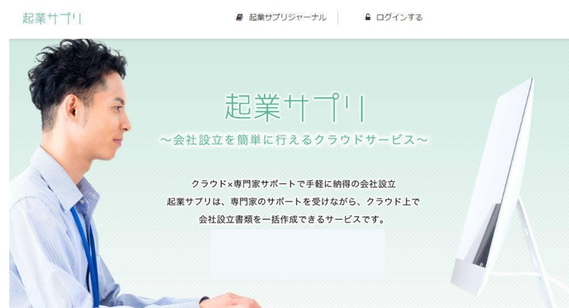
《「起業サプリー」サイトイメージ》