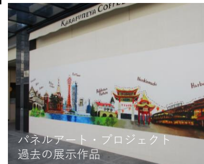
パネルアート・プロジェクト 過去の展示作品

神戸芸術工科大学の協力を得て、2020年よりショッピングセンターの空き区画仮囲いをキャンパスに見立て学生たちが制作した作品を展示する「パネルアート・プロジェクト」を実施してきました。この度のプレんティのリニューアルでは、地元・西区をテーマに学生たちが制作した作品をパークアベニュー沿いウィンドウに常設展示します。