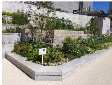
【プレんティ広場花壇】