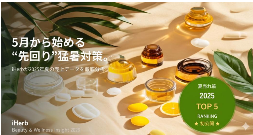
※画像は生成AIを使用して作成したイメージです

気温が上昇し始める時期が年々早まる傾向にあるなか、今夏も昨年に引き続き、暑さへの早めの備えが欠かせない季節が近づいています。実際、夏向け商品の需要は、例年4月中旬～5月初旬から本格的に立ち上がる傾向にあります。本レポートでは、「内側からの抗酸化」と「熱中症リカバリー」の相関を可視化し、2026年の夏を快適に過ごすための「先回りセルフケア」を提案します。