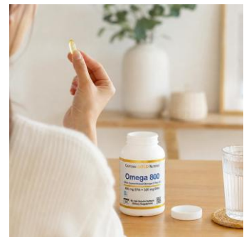
※画像は生成AIを使用して作成したイメージです