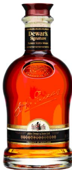
商品名:デュワーズ シグネチャー 容量:700ml 度数:43度 価格:OPEN