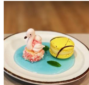
プレゼントのデザート イメージ

・【開業1周年記念日予約特典】食後のデザートプレゼント 開業日(5/30)に限り、レストラン「LOKAL HOUSE」のランチ、もしくはディナーの利用をご予約をいただくと、先着50名様にフラミンゴをモチーフにした食後のデザートをプレゼントいたします。 ※レストランでお召し上がりください。 ※1組8名様までのご利用に限ります。