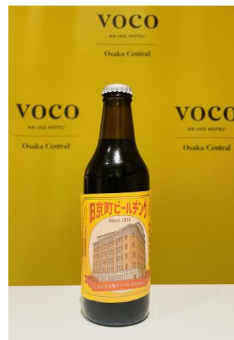
「旧京町ビル」をデザインしたオリジナルラベル と クラフトビール

voco 大阪セントラルは、大阪・京町堀を象徴する歴史的建造物「旧京町ビル」の跡地に昨年2023年5月30日に開業しました。旧京町ビルは1926（大正15）年、かつて大阪が「大大阪」と呼ばれ商工業の繁栄や人口増加などで盛り上がりを見せていた時代に竣工され、旧京町ビルが紡いできたストーリーや歴史を次世代につなぐため、ホテル内には、当時実際に使用されていた郵便ポストや給水管バルブなどをアートワークとして蘇らせています。