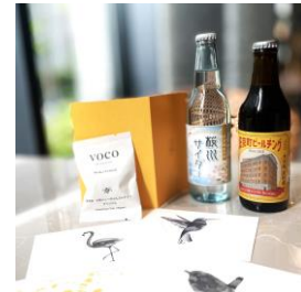
開業1周年記念特別プレゼントセット