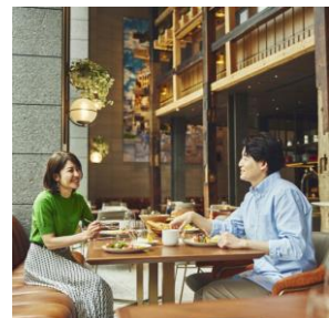
レストラン朝食 イメージ

全てのゲストルームには、リラックスタイムをさらに特別なものにする上下セパレートナイトウェア、ネスプレッソマシンで淹れるコーヒー、ロンネフェルトのお茶、ホットチョコレート、お茶菓子などをご用意しています。ご自宅のように、お部屋でお寛ぎいただけます。