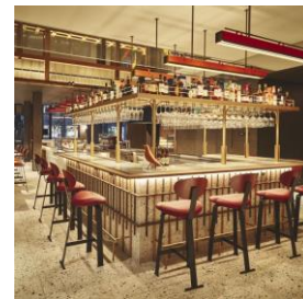
カフェ&バー イメージ

・【開業1周年記念】レストラン・カフェ&バー「LOKAL HOUSE」20%割引クーポン配布 下記の期間中、レストラン・カフェ&バー「LOKAL HOUSE」をご利用のお客様に次回ご利用時、お得にご利用いただけるクーポンを進呈いたします。