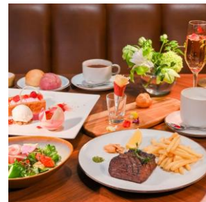
バラ尽くしのディナーコース

メインは、150gのアンガス牛赤身肉のグリル、またはヴァンプランスソースが添えられた150gの鯛のソテーからお選びいただけます。バラの季節限定の料理と共に特別な夕食をご堪能ください。