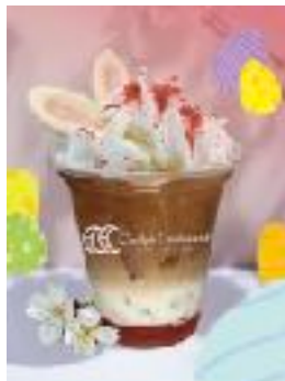
Curly's Croissant TOKYO BAKE STAND