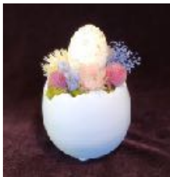
レミルフォイユドゥリベルテ