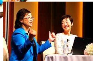
「女性ホルモン塾」100回記念特別セミナー 2014年11月14日撮影