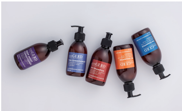
左から、VM ブルーベリーシャンプー 250ml 3,132円、RC クラウドベリーシャンプー 250ml 2,916円、VV リンゴベリーシャンプー 250ml 3,672円、VM ブルーベリーコンディショナー 200ml 3,564円、ディープモイストコンディショナー 200ml 3,672円、すべてケアオブ・ヤード

「最上級のビューティは自然の力、植物の力が与えてくれる」という考えのもと、ビューティ、食、漢方、女性医療などナチュラルで美しいライフスタイルを様々な角度から提案している。「ジュリークショップ青山」「白金台ピオ・パスカル」などサロンやショップのプロデュースや、日本で初めての女性漢方薬局を銀座に設立した経験を持つ。オーガニックビューティの第一人者として、多岐に渡り活躍中。 http://www.biodaikanyama.com/