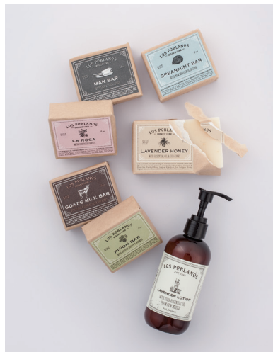
右下から時計回りに、ラベンダーハンド&ボディローション 250ml 4,104円、ピニョウバー(マツの石鹸) 130g 3,024円、マンバー 130g 2,700円、スペアミントスクラブバー 130g 2,700円、ラベンダーソープ 130g 2,700円、すべてロスポブラス