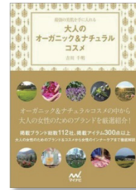
『大人のオーガニック&ナチュラルコスメ ～最強の美肌を手に入れる～』 出版社: マイナビ(2012/12/15) 定価: 本体 1,600円(税別)

会社名 ビオ代官山 所在地 〒150-0021 東京都渋谷区恵比寿西1-33-3 光雲閣ビル303号 TEL 03-6277-5612 FAX 03-6277-5613 Website http://www.biodaikanyama.com/ Facebook https://www.facebook.com/biodaikanyama