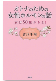
『オトナのための女性ホルモンの話 ～女は50歳からよ!』 出版社: 宝島社(2013/6/12) 定価: 1,440円(税別)