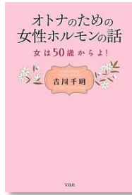
『オトナののための女性ホルモンの話 ~女は50歳からよ!~』 出版社: 宝島社 (2013/6/12) 定価: 1,440円 (税別)