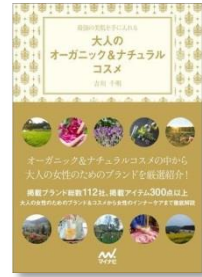
『大人のオーガニック&ナチュラルコ スメ ~最強の美肌を手に入れる~』 出版社: マイナビ (2012/12/15) 定価: 本体1,600円 (税別)

会社名 バイオ代官山 所在地 〒150-0021 東京都渋谷区恵比寿西1-33-3 光雲閣ビル303号 TEL 03-6277-5612 FAX 03-6277-5613 WEBサイト http://www.biodaikanyama.com/ Facebook https://www.facebook.com/biodaikanyama