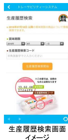
生産履歴検索画面イメージ

アキタでは、今回のARアプリリニューアルをひとつの契機とし、今後も「アキタのたまご」の魅力伝えて参ります。