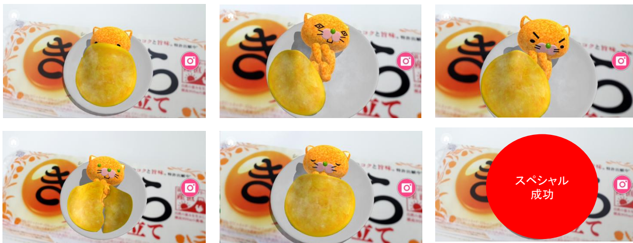
ARアプリ 画面イメージ

今回リニューアルした「きよら グルメ仕立て」のARアプリ(3D)では、アプリ内のARカメラを起動し、「きよら グルメ仕立て」のパッケージにかざすと、画面の中に寝冷えネコ(きよニャ)が現れます。スマートフォンをフライパンに見立て傾げることで、寝冷えネコ(きよニャ)にたまごのお布団を掛けてあげることができ、TVCMの世界を実際に体感いただくことができるものとなっています。たまごのお布団の掛け方に応じて「くるしい…」や「あ～あ! やぶれちゃった」などの音声付きで、寝冷えネコ(きよニャ)がTVCMやWebで公開中のNG集と同様の反応を見せてくれます。TVCMでは見られないスペシャルな表情も…!? (表情は全部で6種類)