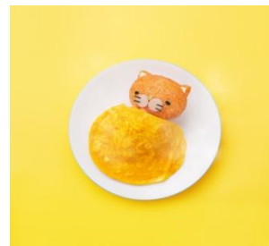
寝冷えネコ(きよニャ)

Instagram(nebieneko): https://www.instagram.com/nebieneko/