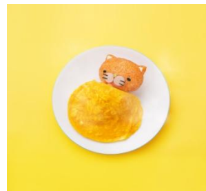
寝冷えネコ(きよニャ)

Instagram(nebieneko)： https://www.instagram.com/nebieneko/