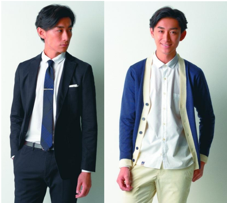
ポップリンシャツの着回し例 (左:ビジネススタイル 右:カジュアルスタイル)