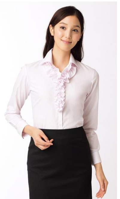
フリルブラウス ピンク