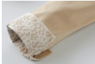
袖部分など、ディテール部分に レースデザインを採用