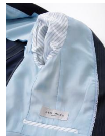
ネイビースーツ 裏地

スーツ・コートの裏地や、ブラウスの袖口ボタンといったディテールに、ミルキーカラーを基調としたバイカラーのデザインを施しました。さりげないかわいさを取り入れつつ、ビジネスシーンでもシンプルに着こなせる商品です。