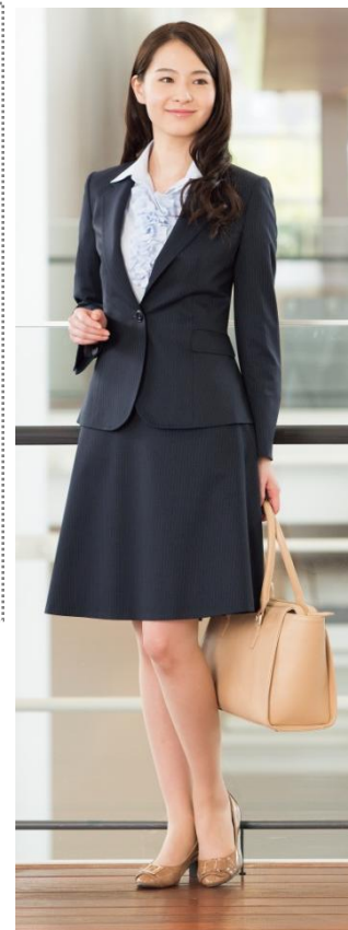
CanCamコラボセットアップスーツ ネイビー

今シーズンのスーツは、フレアで立体感のあるシルエットを採用。ジャケットの長さを昨年の同シリーズより約2cm長くし、動くたびにふんわりと広がるフレアシルエットで、“カワイイ”と“キレイを”両立しました。