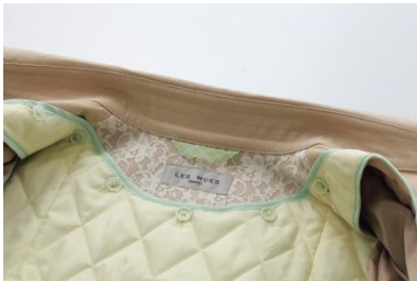
取り外し可能な リバーシブルライナー

背裏と袖口部分に、レース素材を使用。黒とベージュのカラーを展開し、シンプルさとかわいらしさを両立したコートです。