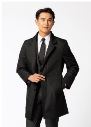
商品名:超軽量あったかコート 税込価格:43,890円 スタイル:ステンカラー(黒/紺)・ スタンドカラー(黒) 素材:ポリエステル100% サイズ:SS~BB3L

AOKIではビジネスパーソンが冬の寒さも快適に乗り越えられる商品の開発に力を尽くしてまいります。