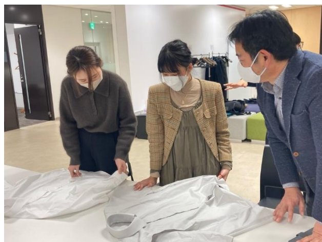
学生とフレックスジャパン株式会社との打合せ風景

これからもORIHICAは、お客様のニーズにお応えする商品をご提供するとともに、ファッション業界を担う次世代デザイナーの育成および、ファッション業界の更なる発展に力を尽くしてまいります。