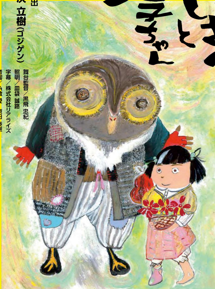
イラスト 倉持 智行