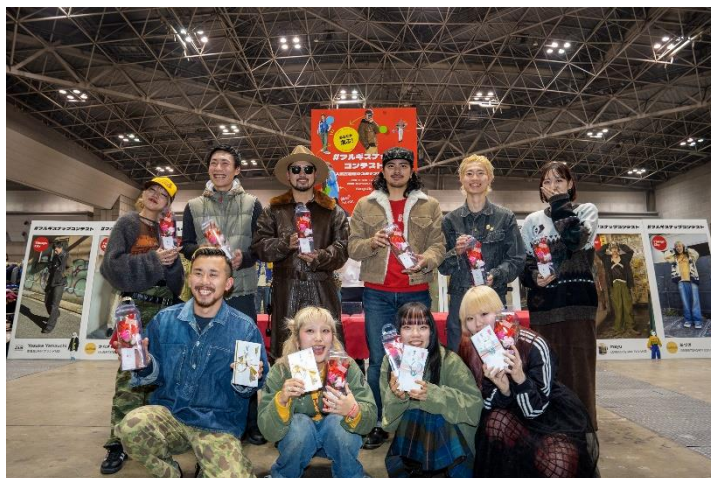
<スナップコンテスト ファイナリスト>