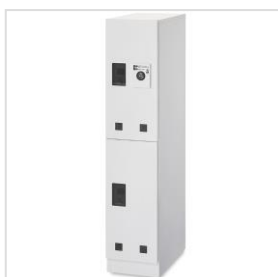
自立型宅配ボックス「TAKURO」