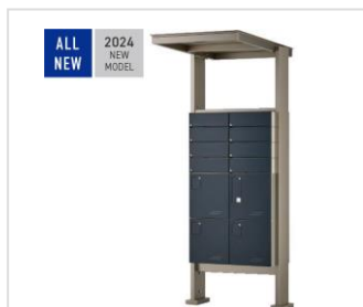
自立設置用フレームユニット「FU」 (2024年6月発売予定)