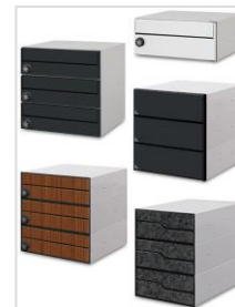
大型郵便対応 メールボックス各機種