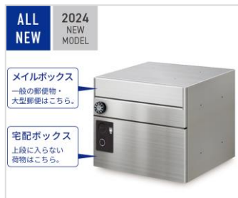
宅配メールボックス「GMX-1」