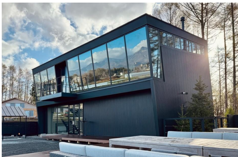
第55回(前回) グランプリ 「AICAFE VILLAGE PROJECT」

1970年より開催し業界最長を誇るストアフロントコンクールでは、昭和フロントのアルミ建材を使用した施工例の中から優秀な作品を表彰し、発表することで、新たなストアフロントの可能性を示す役割を担ってまいりました。