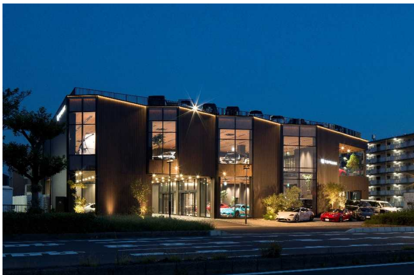
第56回(前回)グランプリ 「トップランク本店」

1970年より開催し、今年で57年目となるストアフロントコンクールでは、昭和フロントのアルミ建材を使用した施工例の中から優秀な作品を表彰し、発表することで、新たなストアフロントの可能性を示す役割を担ってまいりました。