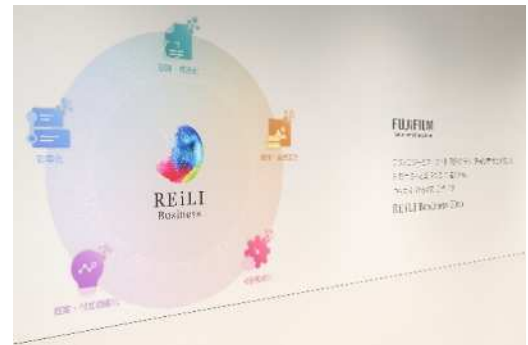
「REiLI Business Hub」拠点内の様子