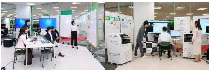
専門分野や役割の異なるメンバーが連携している様子

「REiLI Business Hub」では、検証エリアや成果物の共有スペース、議論や共創を促すコラボレーションエリアを組み合わせることで、アイデア創出から検証を経て、商品・サービス化までのプロセスを円滑につなげます。さらに、当社が推進する「Activity Based Working」※2の考え方を取り入れ、業務内容に応じて最適な働く場所を柔軟に選択できる空間設計としました。このような空間設計と働き方の工夫により、部門や専門領域を越えた日常的なコミュニケーションや試行が自然と生まれ、新たなビジネス価値の創出を加速させます。