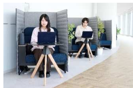
集中エリアで働く様子