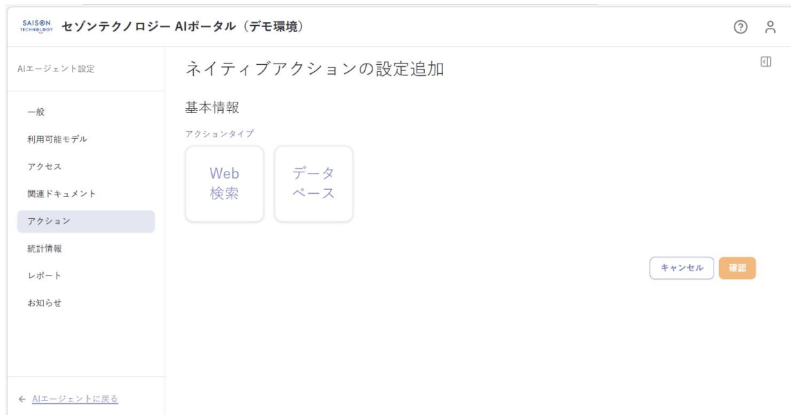
エージェントに対してアクションを付与する管理者画面