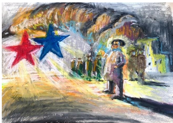
イラスト：山下昇平

日時 8月5日（土）～ 6日（日） 8月5日（土）17:00、6日（日）13:00