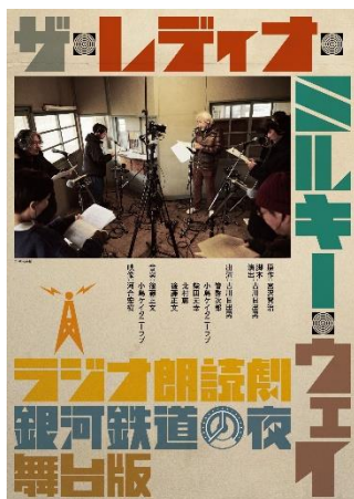
ポスター：梶田透 (nix graphics)