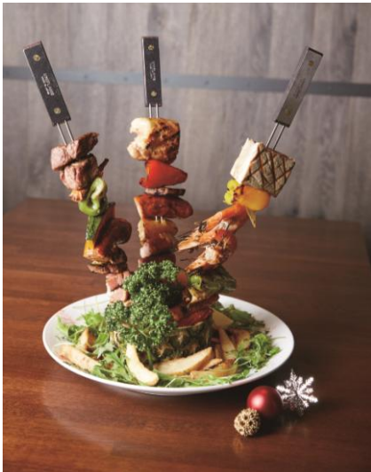
＜ハワイアンBBQスキュアースペシャル＞ (Guy & Jo's Hawaiian Style Café)

今春開業した「東急プラザ銀座」には、毎日立ち寄りたくなるバラエティ豊かなレストラン・カフェが揃っています。東急プラザ銀座が初めて迎えるクリスマスには、各ショップから特別な日を、より上質に演出するグルメ商品が多数登場。銀座の夜景を眺めながら召し上がっていただける限定クリスマスメニューで特別な日を、東急プラザ銀座にてお過ごしいただくのはもちろん、ご自宅のクリスマスをいっそう盛り上げる、プレミアムなクリスマスケーキや、家族や知人・友人と過ごすホリデーにオススメのグルメギフトなど、銀座の大人を満足させる大人のためのクリスマスグルメ商品をご用意しました。東急プラザ銀座ならではの、上質な大人のクリスマスを演出いたします。