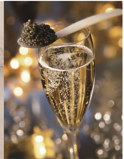
＜キャビア商品 各種＞ (CAVIAR HOUSE & PRUNIER / SANDWICH HOUSE)

＜本件に関するお問い合わせ先＞ 東急プラザ銀座PR事務局(株式会社イニシャル内) 担当: 渡邊、野村、丸山 TEL: 03-5572-6064、FAX: 03-5572-6065、E-MAIL: g5@vectorinc.co.jp