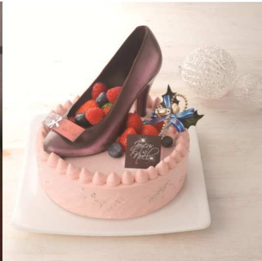
＜クリスマスケーキ＞ (Pâtisserie Les années folles)